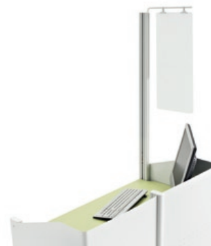
Signalétique. Réf. : SAT SIGN