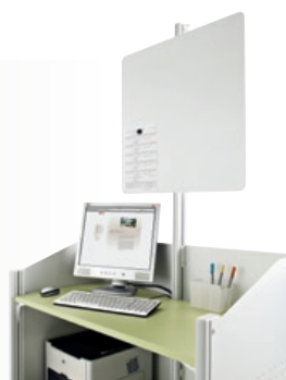
Panneau d'affichage Réf. : SAT AFF